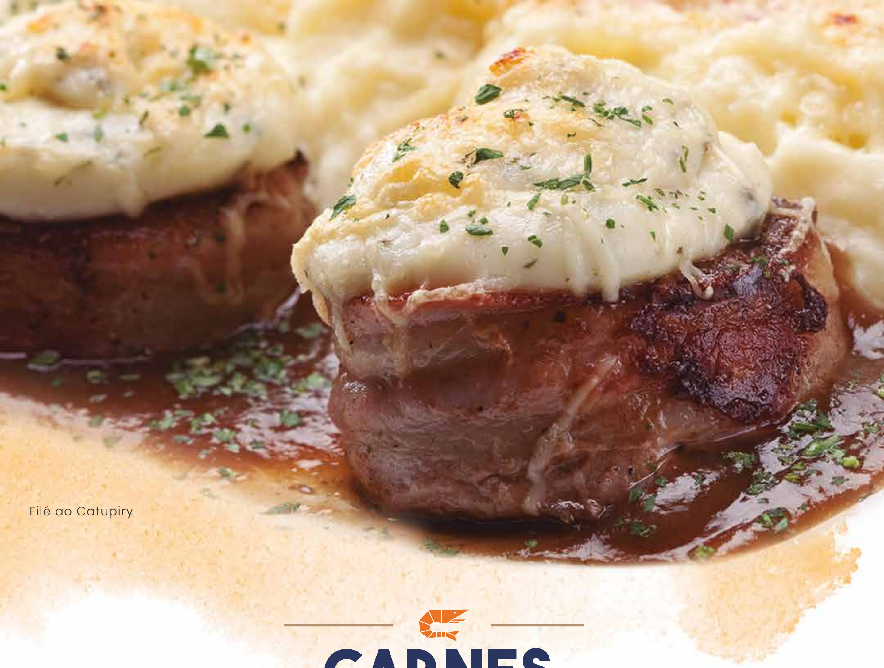
Filé ao Catupiry