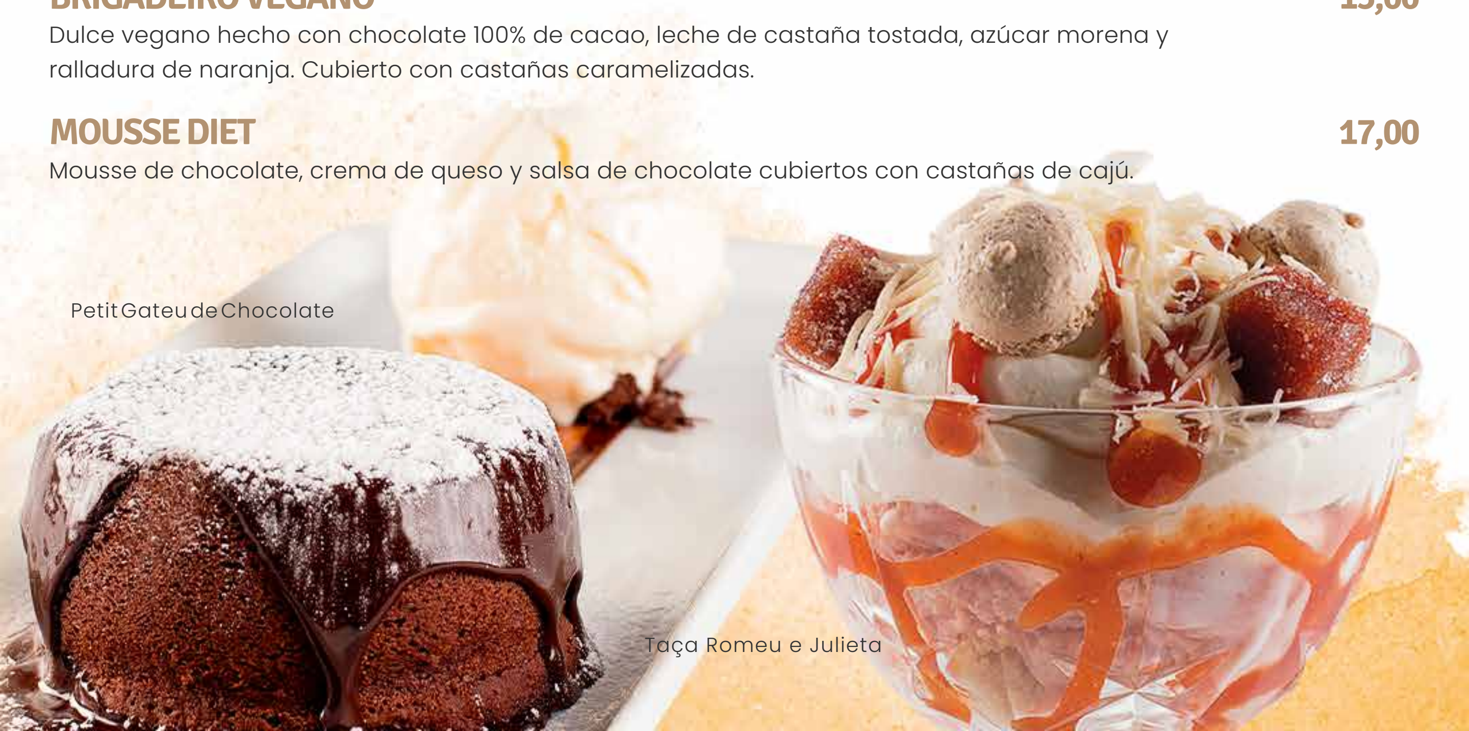
Taçã Romeu e Julieta