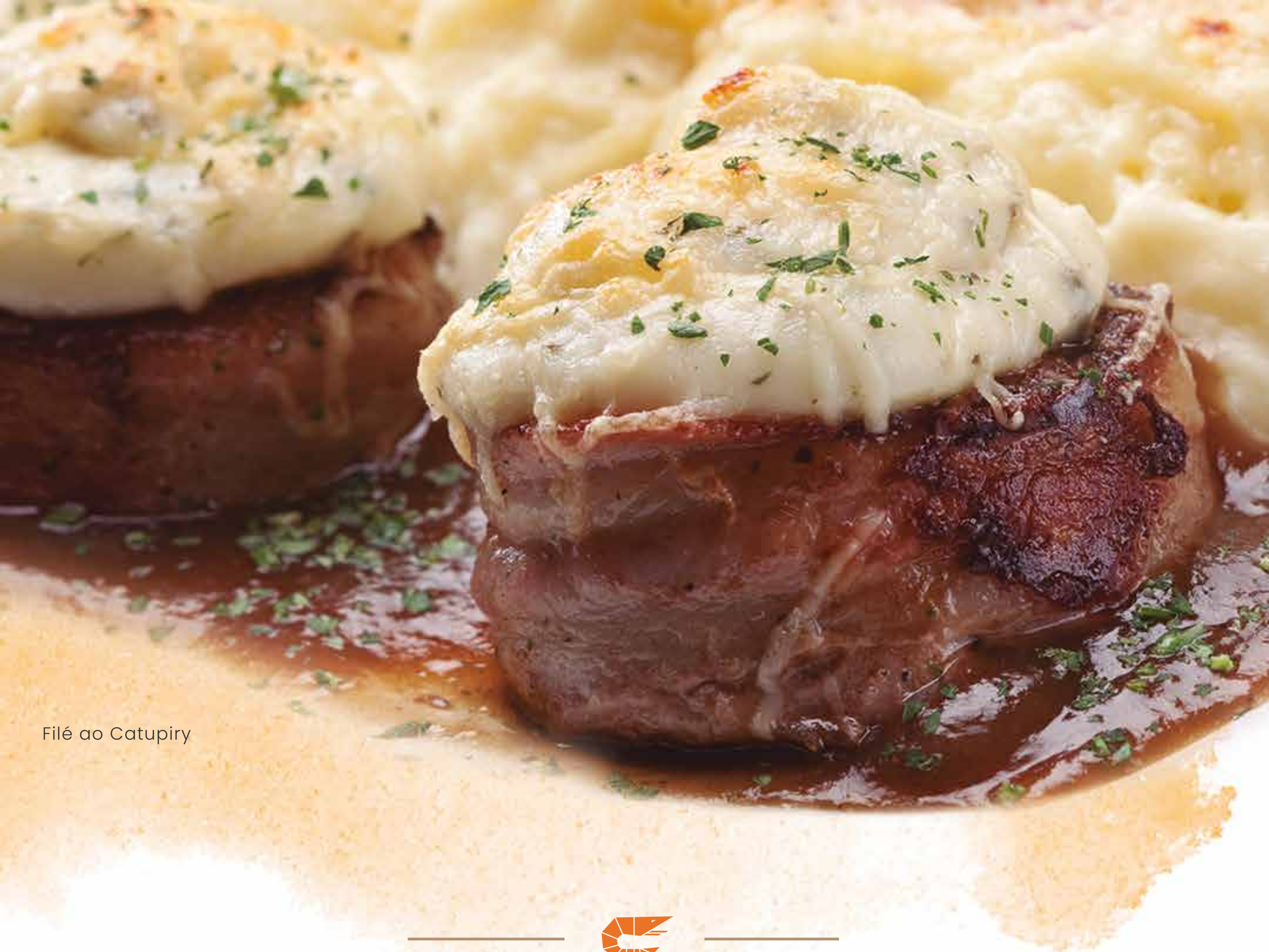
Filé ao Catupiry