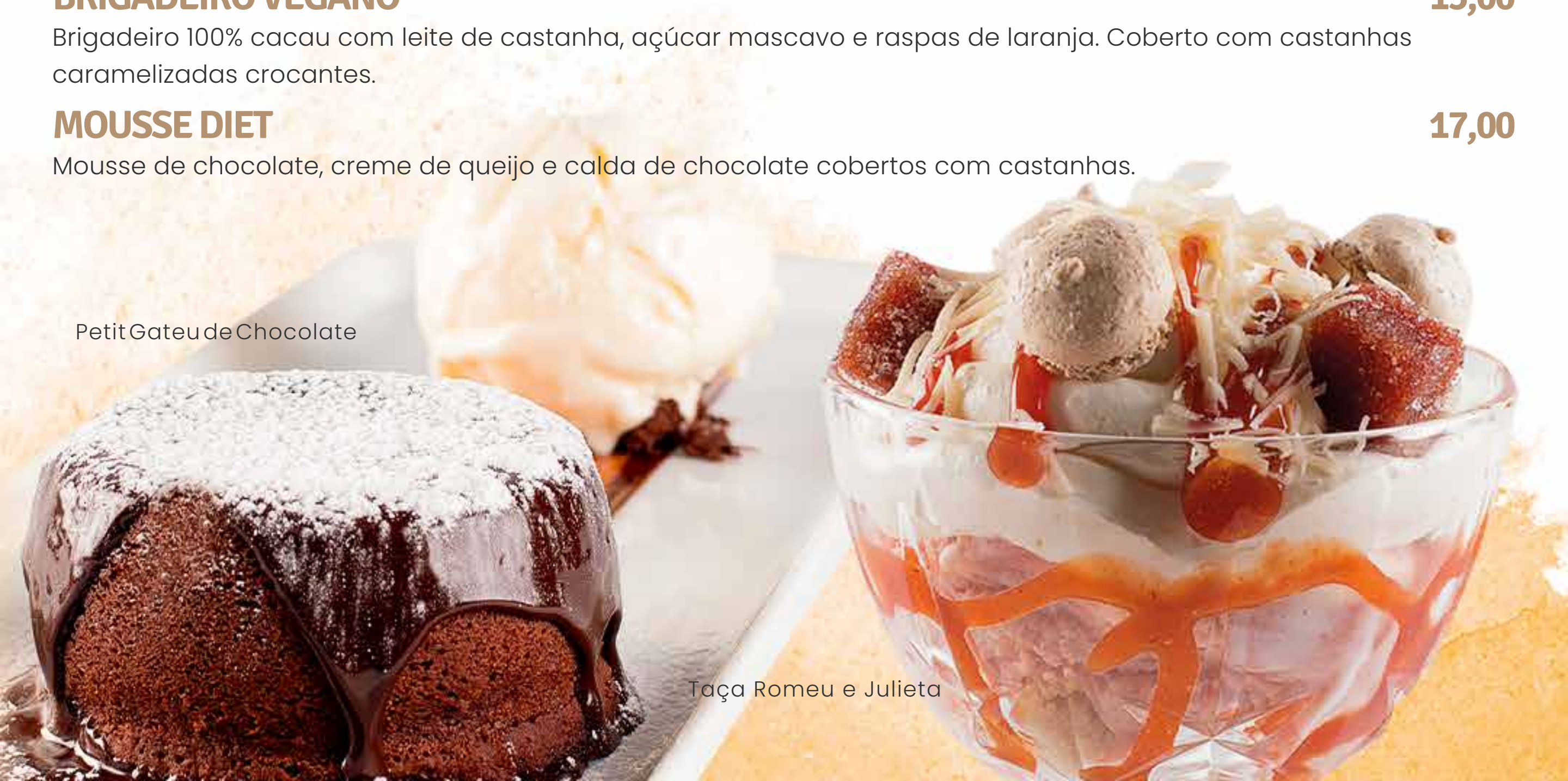
Taça Romeu e Julieta